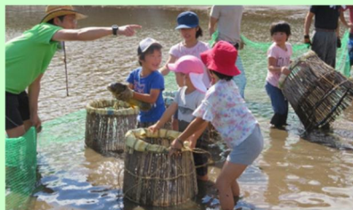
伝統漁法のウグイ突き漁

ウグイ突き漁、景観形成活動、草刈り、水路清掃、鳥獣害防護柵の設置などの活動に大学生がボランティアとして参加するとともに、地元小学校からも郷土学習として参加しています。また、地元青年団に所属する若い世代も、活動組織指導のもと、農業用施設の補修活動を実施しています。