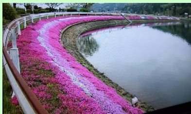
芝桜での景観形成活動