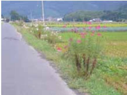
コスモスの花が咲きました