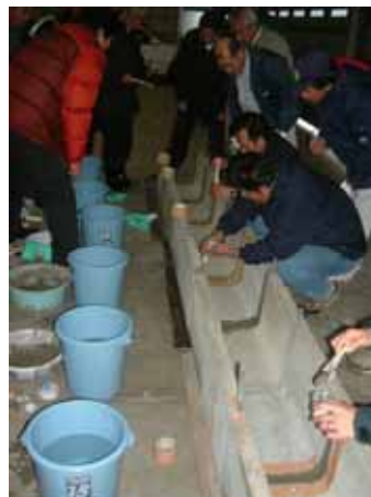
プライマーの塗布