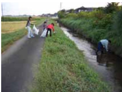
地域住民による美化活動