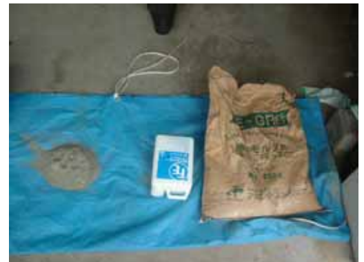
繊維モルタル(左)とプライマー(中央)