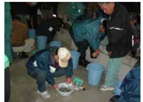
繊維モルタルとプライマーの混練