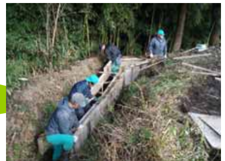
自主施工による水路の補修

従来の事業と比べて、多様な活動に自ら気軽に取り組めるため、地域住民が活気づいてきた。