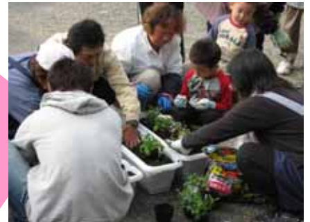
プランターへの植栽