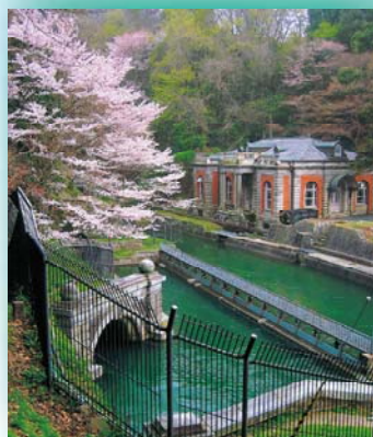
平成19年度 優秀賞「桜日」 京都府 木下正治（琵琶湖疏水）