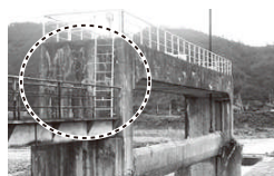
ヒビのはいた水門