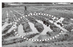
水はけの悪い農地